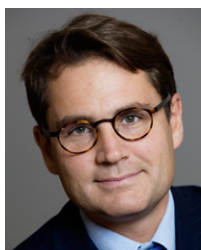
Økonomi- og Erhvervsminister Brian Mikkelsen